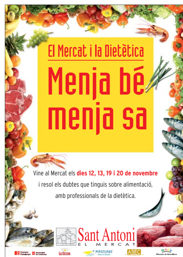
2008. Cartell dietètica