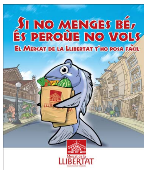
2008. Follet informatiu