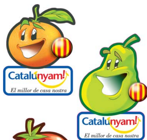
2007. Imans nevera