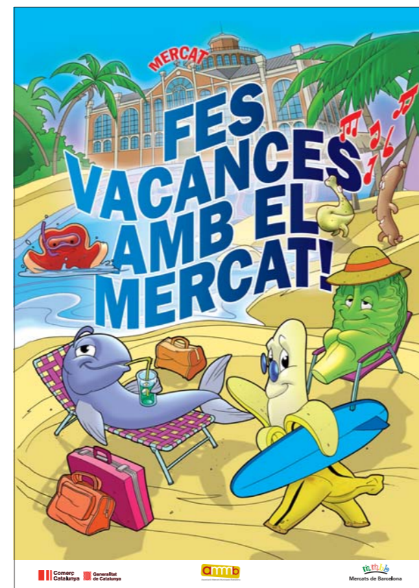
2008. Cartell estiu